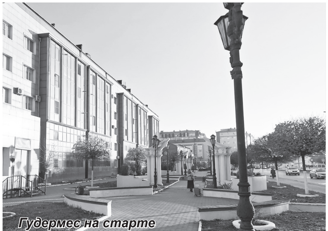
Гудермес на старте

основанного на справедливости и равноправии в мире!» ИА «Грозный-информ»