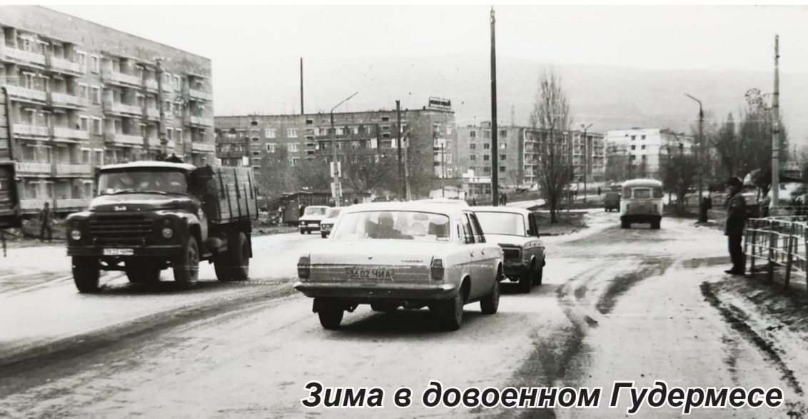
Зима в довоенном Гудермесе