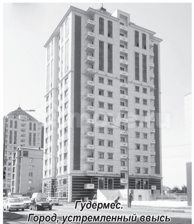
Гудермес. Город, устремленный ввысь