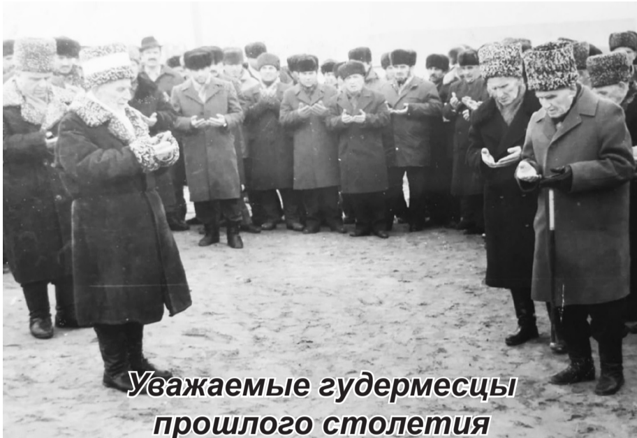
Уважаемые гудермесцы прошлого столетия