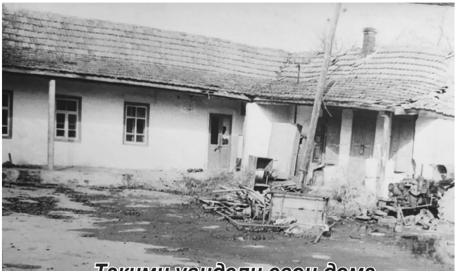
Такими увидели свои дома гудермесцы в дни возвращения из выселения