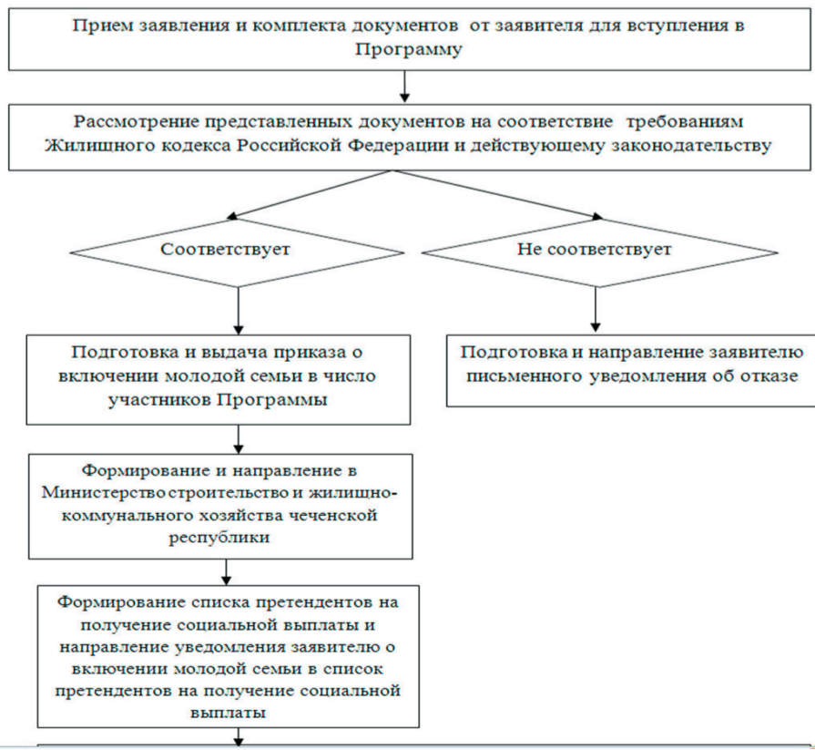
Приложение № 3 к административному регламенту Блок-схема