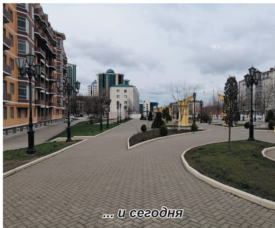
... и сегодня