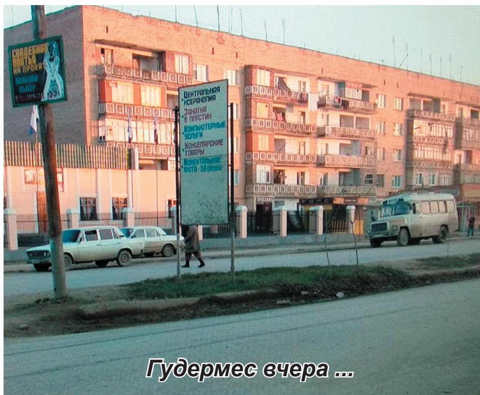
Гудермес вчера ...